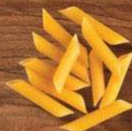
Pena | Penne Renata Superiore, Renata Ovos, Renata Superiore Integrale, Renata Sem Glúten, Galo Sêmola, Galo Semolado, Galo Integral