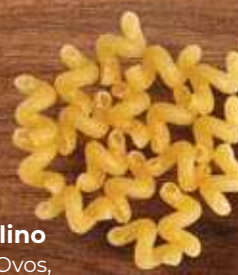
Caracolino Renata Ovos, Galo Sêmola