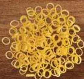
Argola Galo Sêmola