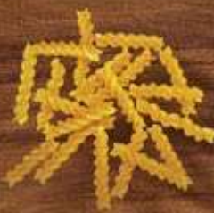
Parafusinho Renata Ovos, Galo Sêmola