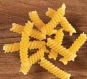
Parafuso | Fusilli Renata Superiore, Renata Ovos, Renata Superiore Integrale, Renata Sem Glúten, Galo Sêmola, Galo Semolado, Galo Integral