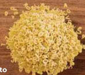
Alfabeto Renata Divertix, Galo Show