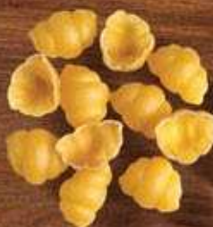
Nhoque Renata Ovos, Galo Sêmola