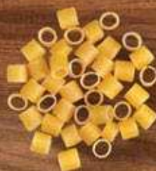
Padre Nosso Renata Ovos, Galo Sêmola, Galo Semolado