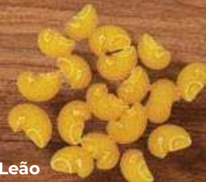
Boca de Leão Galo Sêmola